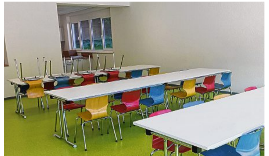
Die Mensa lädt mit ihren bunten Stühlen zum Verweilen ein.

Selbstverständlich kann an diesem Tag das Gebäude von Jedermann besucht und besichtigt werden.