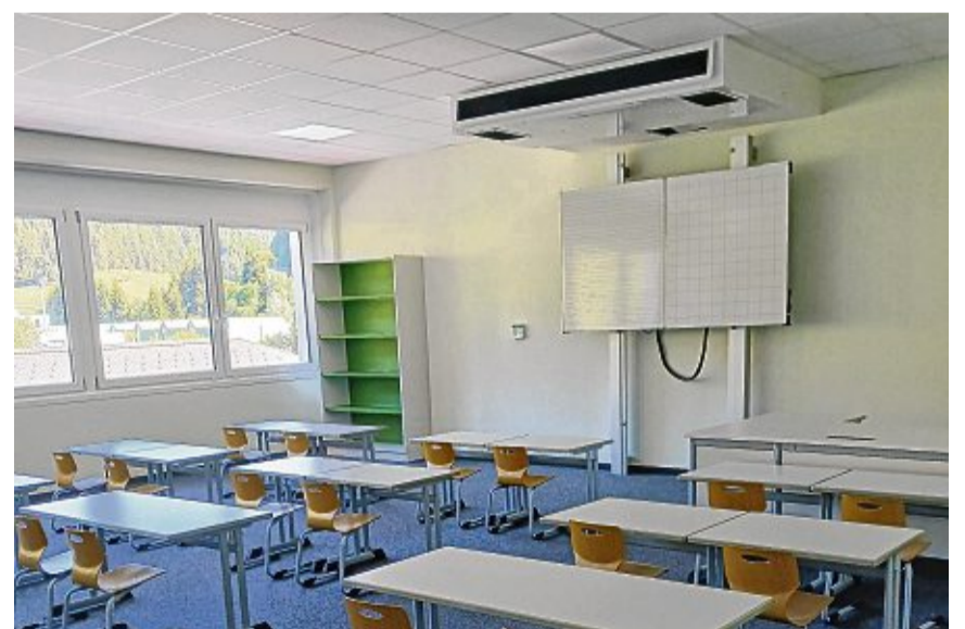
Die Klassenzimmer sind neu und modern eingerichtet.